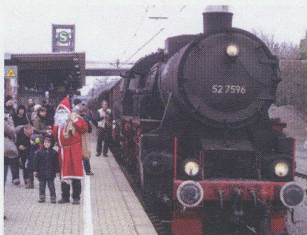
Standardrolle „Nikolaus“: Posieren vor der Dampflok in Kornthal.

Abends in Kornwestheim waren dann alle Beteiligten froh, wieder auf der GWA zu sein. Für viele war es der zweite Fahrtag in Folge. Der Zug und die Restauration wurden noch frostsicher gemacht und die 52er für die Rückfahrt nach